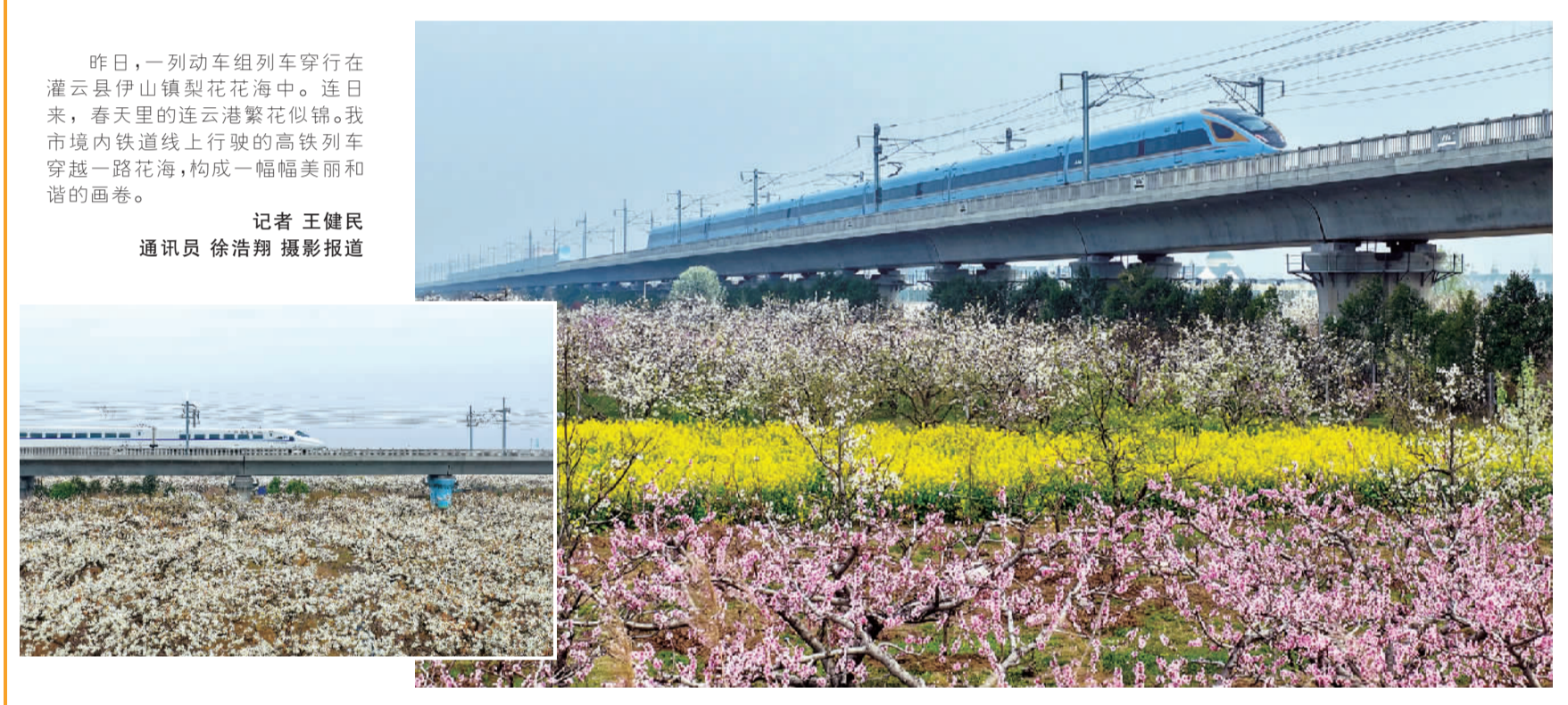
昨日，一列动车组列车穿行在灌云县伊山镇梨花花海中。连日来，春天里的连云港繁花似锦。我市境内铁道线上行驶的高铁列车穿越一路花海，构成一幅幅美丽的画卷。

此次首个钢衬里模块吊装完成后，施工团队立刻转入后续焊接、无损检测工作，而本次摸索出的智能焊接与大型模块吊装经验，也将直接应用于后续5个钢衬里筒体模块的施工，为核岛主体施工提速奠定坚实基础。